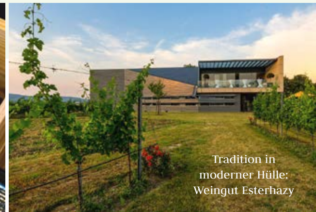
Tradition in moderner Hülle: Weingut Esterhazy