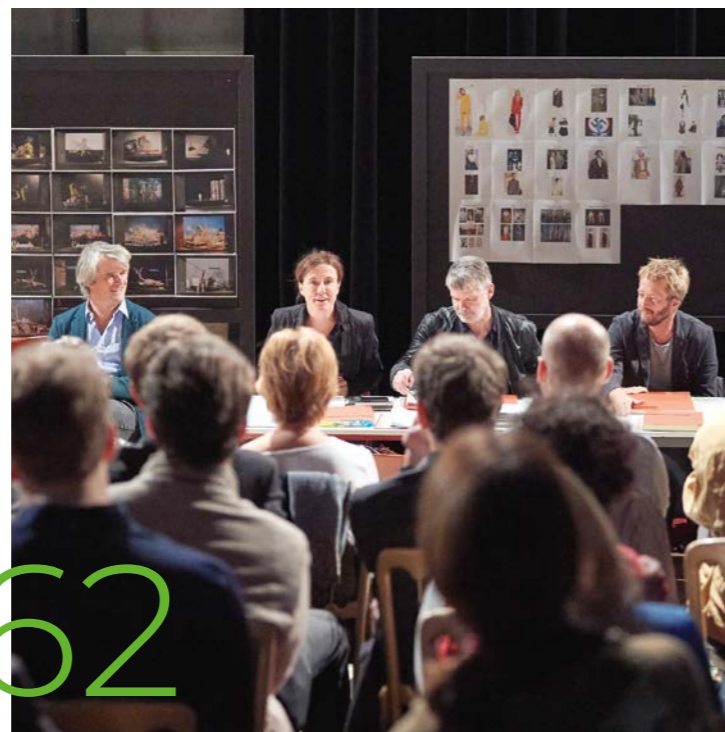
Vorbericht zu »Die Weiden« – Uraufführung der Wiener Staatsoper