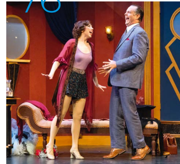
Leichte Muse – Die BR-Klassik-Monatsfrösche