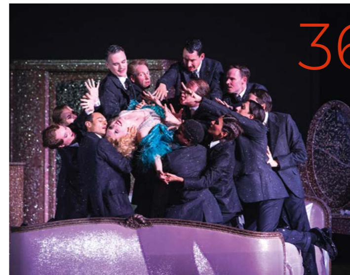
»Die tote Stadt« in der Dresdner Semperoper