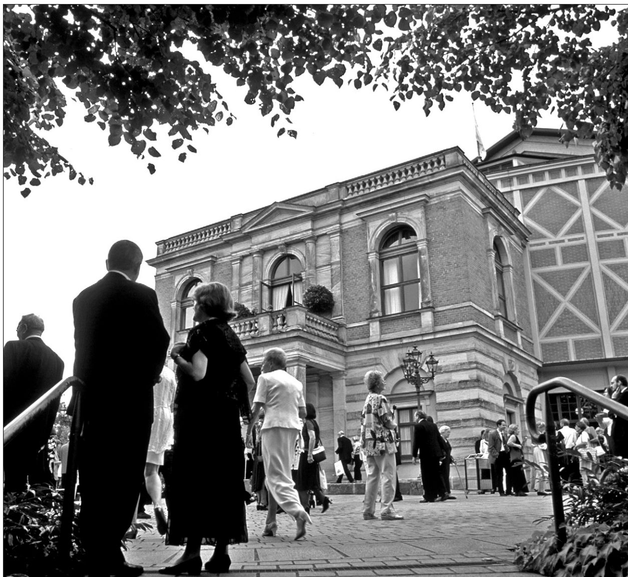
Zum 99. Mal Wallfahrtsort der Wagnerianer: Das Festspielhaus in Bayreuth.

Das ist natürlich nicht mehr konkret nachweisbar, und ich bin kein Mediziner. Fakt ist, dass Levi mit Mitte 50 seinen Job in München aufgegeben hat. Das war auch damals bereits ein ungewöhnlich frühes Karriereende für einen Dirigenten. Bereits 1882, also bald nach den ersten Bayreuther Festspielen, musste er ein Konzert in München abbrechen. Aus seinen eigenen Briefen geht erschütternd klar hervor, wie sehr ihn die Situation belastete und