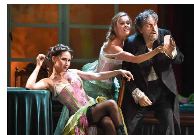
»Ring«-Auftakt in Düsseldorf Musikgenuss an der Deutschen Oper am Rhein