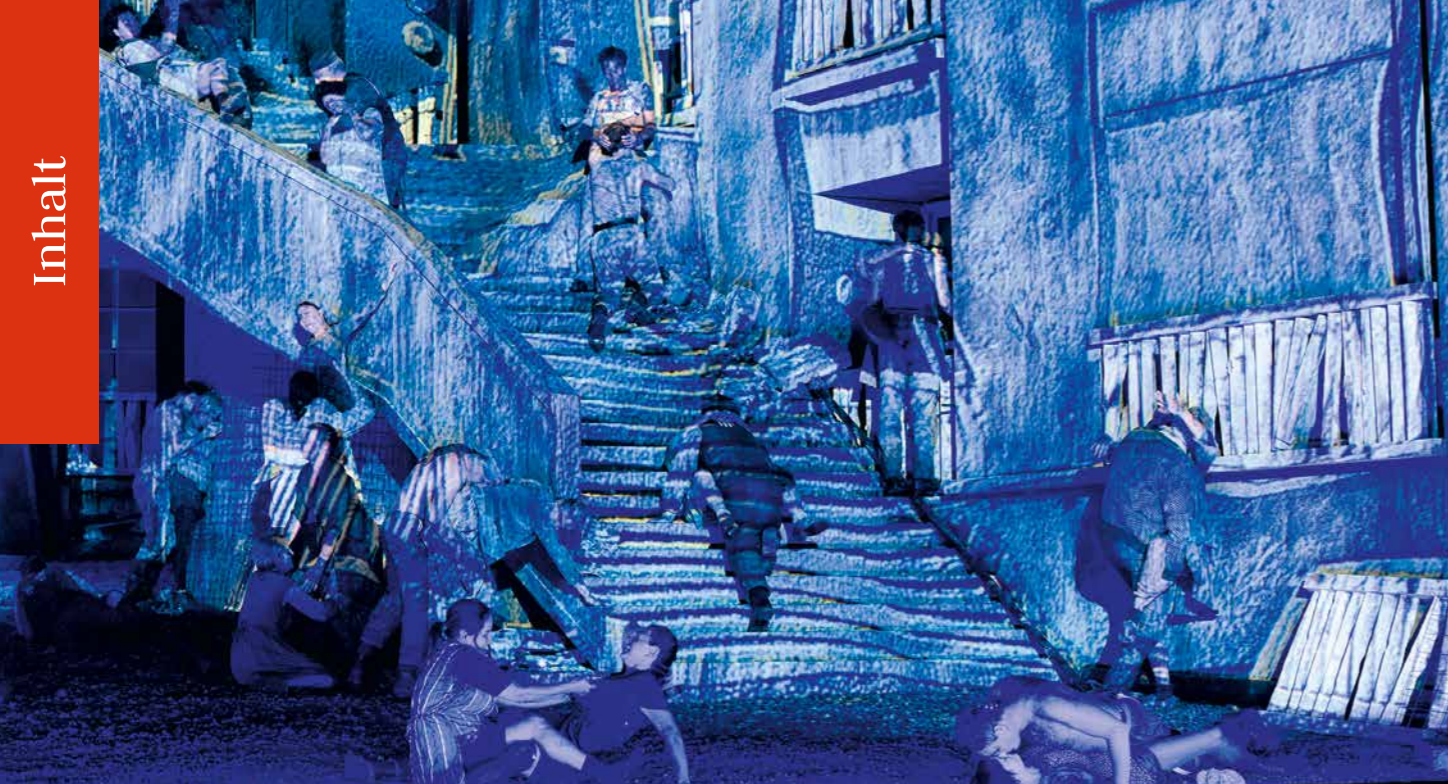
Traumbilder in Salzburg Für Sie gesehen / Ö-Ton: »Lady Macbeth von Mzensk«