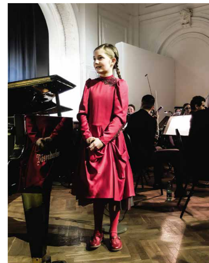
Alma Deutscher Eine starke Persönlichkeit