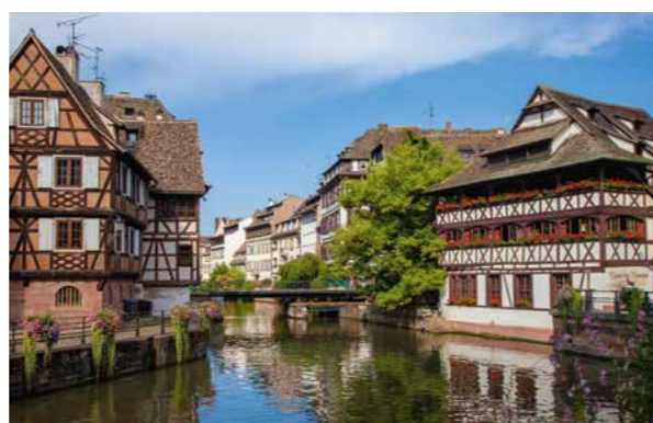
Elsass: Oper im Grenzbereich Opéra national du Rhin / Intendanten-Interviews