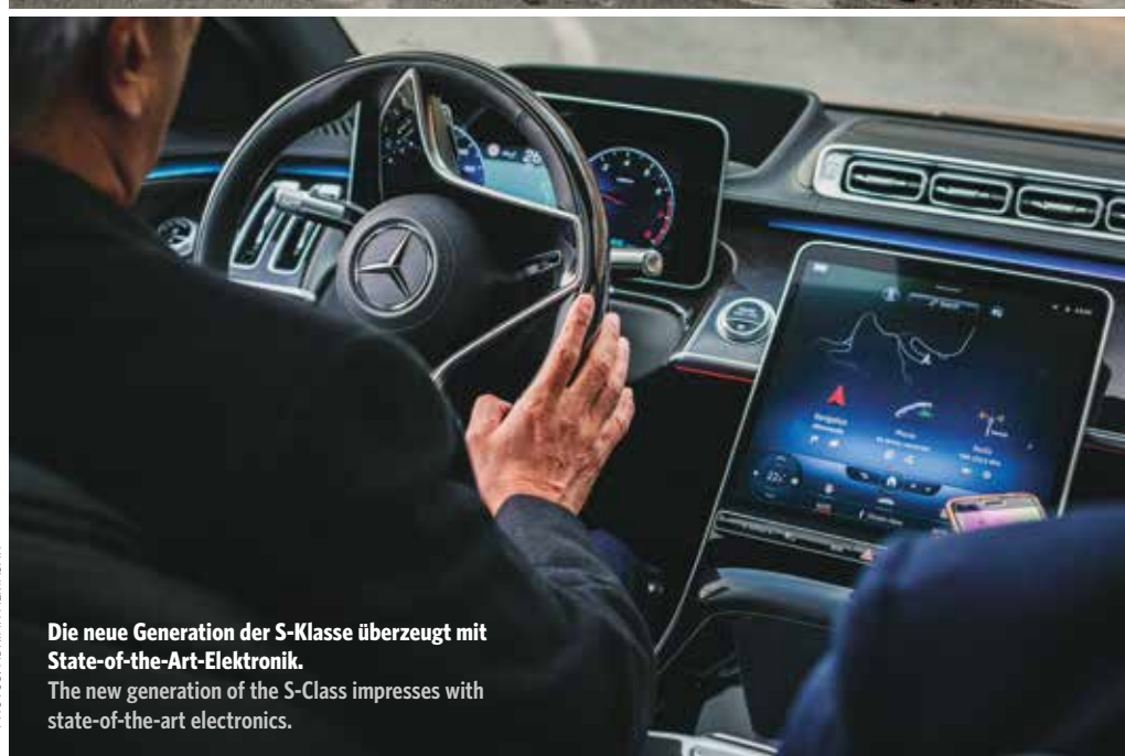
Die neue Generation der S-Klasse überzeugt mit State-of-the-Art-Elektronik. The new generation of the S-Class impresses with state-of-the-art electronics.