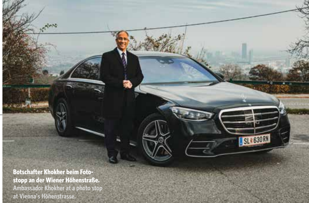
Botschafter Khokher beim Foto-stopp an der Wiener Höhenstraße. Ambassador Khokher at a photo stop at Vienna's Höhenstrasse.

jetzt vielleicht wenig überraschen. Umso mehr werden sie aber die neuen, über einen großen Bildschirm digital zu steuernden Features faszinieren. Der digitale Tachometer und das Navi daneben werden in einer 3D-Optik geboten. So manche Spielereien bleiben uns auf der Höhenstraßenfahrt indes verborgen: Fußgänger am Straßenrand werden mit Spots vor dem Wagen gewarnt, und bei schmalen Fahrstreifen an Baustellen wird ein Feld zwecks Abschätzung der Wagenbreite auf die Straße projiziert. Bleibt die Frage: Wo sind die Fußgänger und die Baustellen, wenn man sie mal braucht?