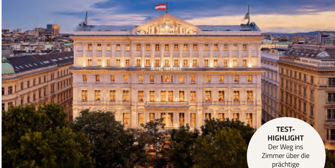
EINE INSTITUTION AN DER RINGSTRASSE Das Imperial

TEST-HIGHLIGHT Der Weg ins Fürstenstige und die Beletage