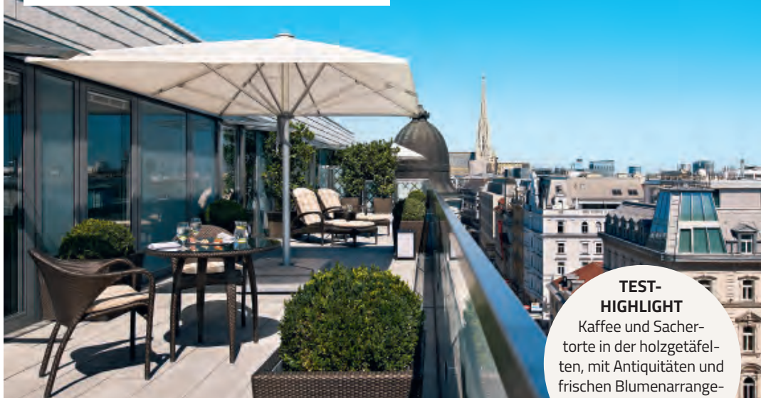
PLATZ AN DER SONNE in einer der Dachgeschoss-Suiten

TEST-HIGHLIGHT Kaffee und Sachertorte in der holzgetäfelten, mit Antiquitäten und frischen Blumenarrangements geschmückten Lobby